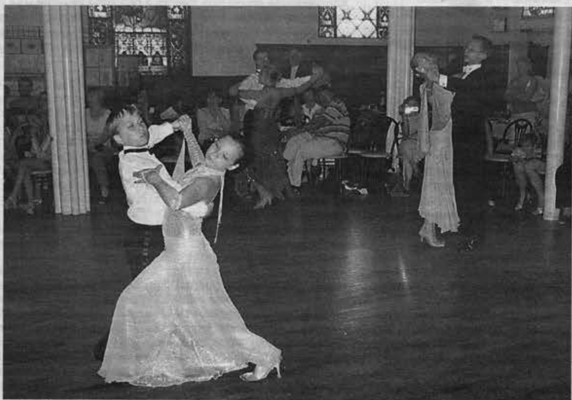
Pokaz tańca towarzyskiego na niedzielnym festiwalu na Greenpoincie