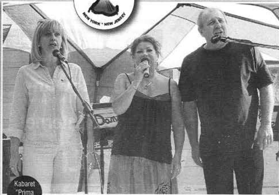
Kabaret "Prima Aprilis"