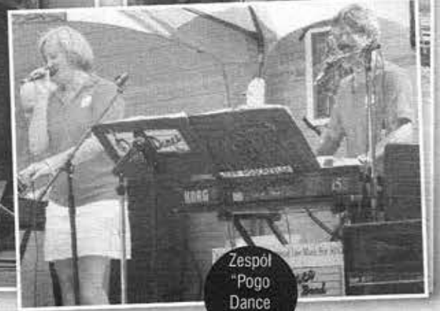
Zespół "Pogo Dance Band"